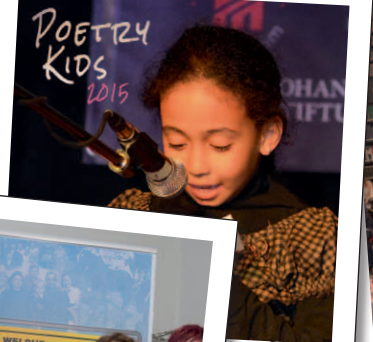
Poetry Kids 2015