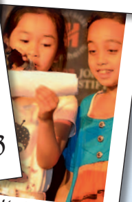
Poetry Kids 2015