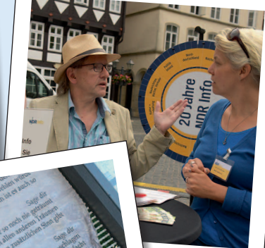
Radio NDR Info 2018