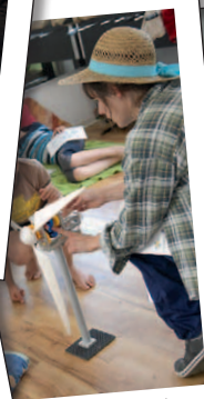
Poetry Kids 2015